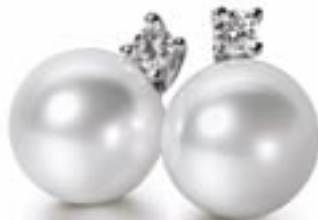
Til højre: South Sea perle- og brillantørestikker kr. 22.425,- Design: Schoeffel.

Til at begynde med havde Mikimoto held med at dyrke en halvt formet perle. Først 12 år senere lykkedes det ham at lave den perfekte runde perle, med udseende præcis som den naturlige, skabt af en musling. Dette blev fundamentet til den kulturperle vi kender, dyrker og smykker os med i dag.