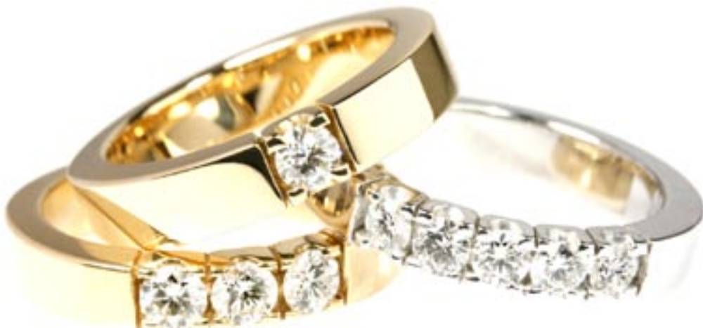
Allianceringe/vielsesringe med brillanter fra kr. 5.600,- Design: Klarlund.

Klarlund har også designet vielses- og forlovelsesringe til samme anledning. De fås i mange kombinationer, flere farver guld og platin, med eller uden brillanter. Priserne på perlesmykkerne er vejledende, da hver kulturperle er unik. Perlerne prissættes ud fra en samlet vurdering af kombinationen størrelse, glans, form, farve og overfladestruktur.