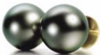
Herover: Tabiti kulturperleørestikker af guld, 9,0 – 10,0 mm. fra kr. 6.700,- Design: Schoeffel.